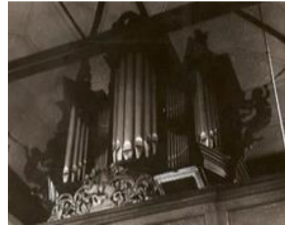
Orgel in de Oude Kerk

In 1643 bestelde het kerkbestuur een orgel voor de kerk. Uit het opschrift in de kerk blijkt dat het orgel van de beroemde orgelmaker Hinsz, in 1751 is geplaatst.