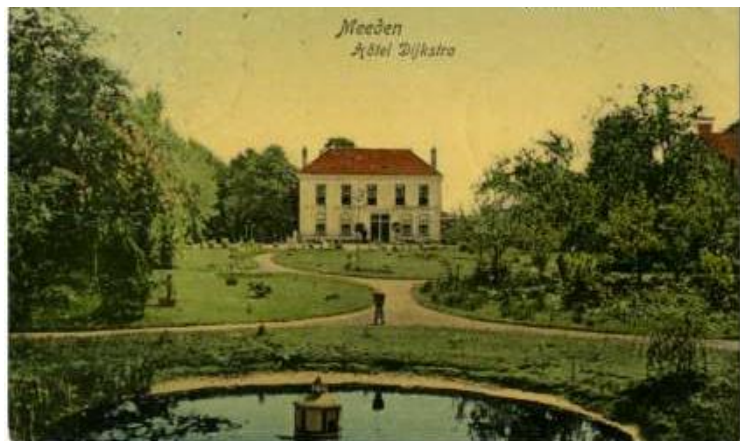
Hotel Dijkstra met slingertuin en mooie bomen

Aan de kant van Westerlee liepen de beide veensloten over in het Mastebroek. De boerderij op de grens van Meeden en Westerlee draagt nog steeds de naam Mastenbroek. Door deze maatregelen kwam er veel land beschikbaar voor het verbouwen van graan, aardappels en later ook suikerbieten. Vanaf 1800 stijgen de graanprijzen sterk en worden de boeren uit Meeden rijk. De boerderijen worden