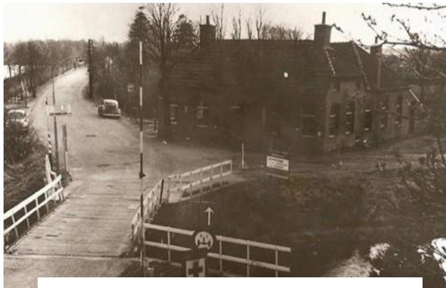
Bekende tolhek op de grens van Muntendam en Meeden

Wilde je het dorp binnen komen, dan moest je tol (= belasting) betalen. Langs de A7 ligt nu nog de Meedener tol. Die lag vroeger op de grens van Meeden en Scheemda. Bekender in Meeden waren de tolhekken op de grens met Westerlee en Muntendam.