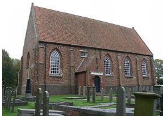
Oude Kerk aan de Kerkstraat