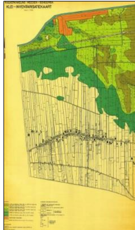
Gebied boven Meeden (ingekleurd), waar de verschillende kleisoorten zich bevinden, klei-inventarisatiekaart (1965)

Tussen 1200-1300 was er sprake van de eerste bewoning. Er zijn scherven van kookpotten gevonden en ook oude kloosterstenen uit die tijd. De mensen hielden al vee, want in boeken van het bisdom Münster (Duitse stad) worden de hooilanden van Meeden al genoemd. In