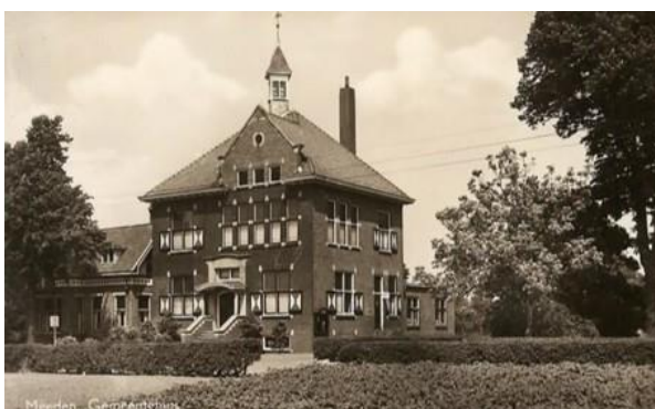
Meeden - Gemeentehuis

Verder stonden aan de Hereweg nog het gemeentehuis (waar nu Woltman antiquair is, dit is het zogenaamde 'nieuwe gemeentehuis') en een postkantoor (nu 't Eethuske).