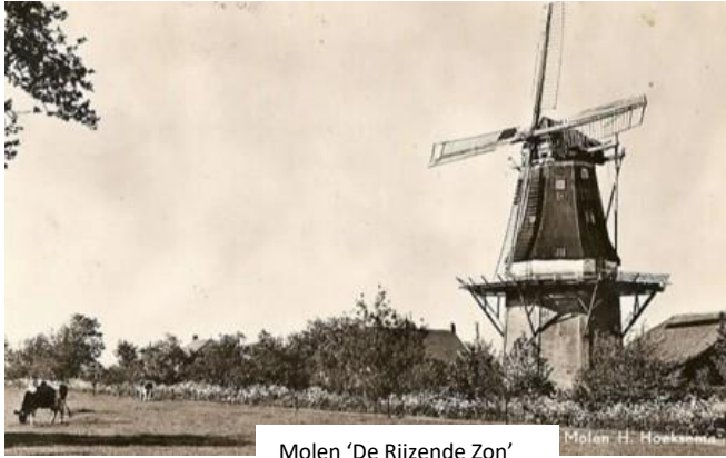
Molen 'De Rijzende Zon'

De laatste twee molens die in Meeden gedraaid hebben, waren de 'Rijzende Zon' aan de Molenlaan en molen 'Luth' aan de Kerkstraat. De straat 'Tussen Baide Meulens' heeft zijn naam aan deze beide molens te danken.