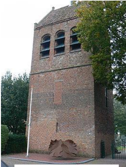
Kerktoeren naast de Oude Kerk

Vlakbij de kerk begon men omstreeks 1500 met de bouw van een toren. Deze toren is 21 meter hoog en heeft muren van bijna anderhalve meter dikte. In tijden van gevaar of overstroming konden de mensen zich daarin terugtrekken.